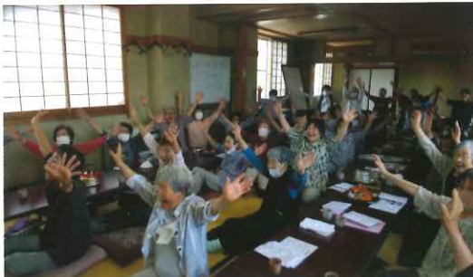
笑いヨガに参加する皆さん

実施日：毎月第3水曜日 時間：午前10時～12時頃まで 場所：旭町会館 参加費：200円(弁当付き) 対象者：旭町にお住いの方 連絡先：社協(23-8105)までご連絡ください