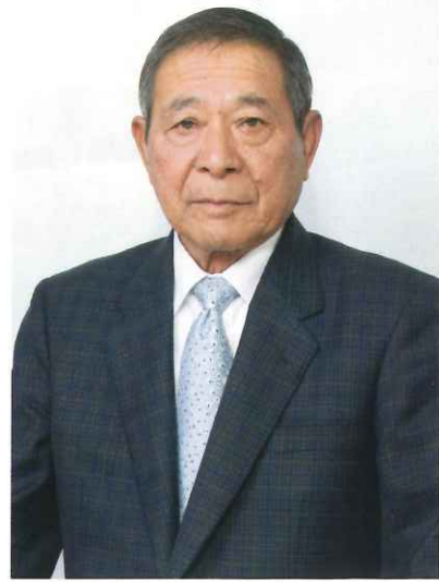
社会福祉法人 富士吉田市社会福祉協議会