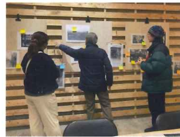
古い資料を見て、その場で情報を加える「Koko Doko展」の様子。